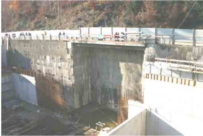
Portail du tunnel CFF

Pour le tunnel d'amenée des déchets à l'usine Tridel, en cours de perçage depuis la Borde (derrière le dépôt TL), les mineurs ont passé de la fraise rotative à l'explosif. Ce sont trois volées journalières qui font progresser le tunnel d'une dizaine de mètres par jour en direction de Sauvabelin.