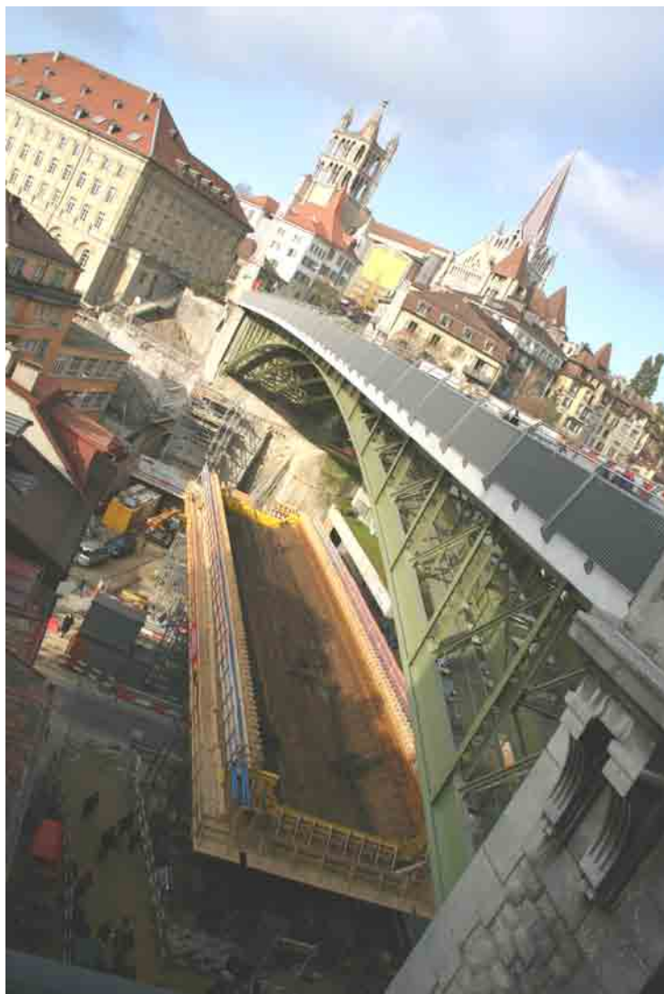
ci-dessus : le pont pour le M2 sous le pont Bessières.

Si vous n'avez pas pu profiter de la visite du 4 décembre 2004, jour de la Sainte Barbe patron des mineurs, voici les points essentiels qui concernent notre quartier.