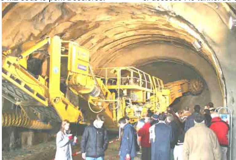
ci-dessous : le tunnel du CHUV

La galerie de la Place de l'Europe, qui a fait l'objet d'une visite le 22 novembre dernier, est en pleine molasse. Quelques fissures de peu d'importance sont apparues, la qualité du terrain est meilleure que celle enregistrée par les sondages.