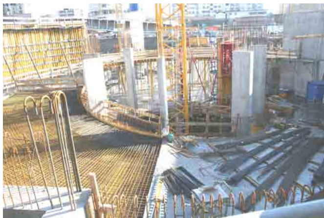
Rampe d'accès de l'usine Tridel